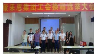
新一届工会委员、经审委委员与领导合影留念

体统一。要积极贯宣公司的政策、战略、文化、精神;要引导员工发挥主人翁精神,在工作中时刻以集团公司发展大局为重;也要关注每位员工的业绩,树立我们身边的榜样。二是要加强工会自身组织的